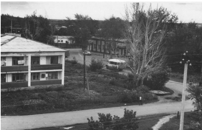
Центр села в 80-е годы. Улица Ленина

В 1882 году построили 3-х этажную школу на 624 места, для самых маленьких жителей села был построен детский сад на 140 мест.