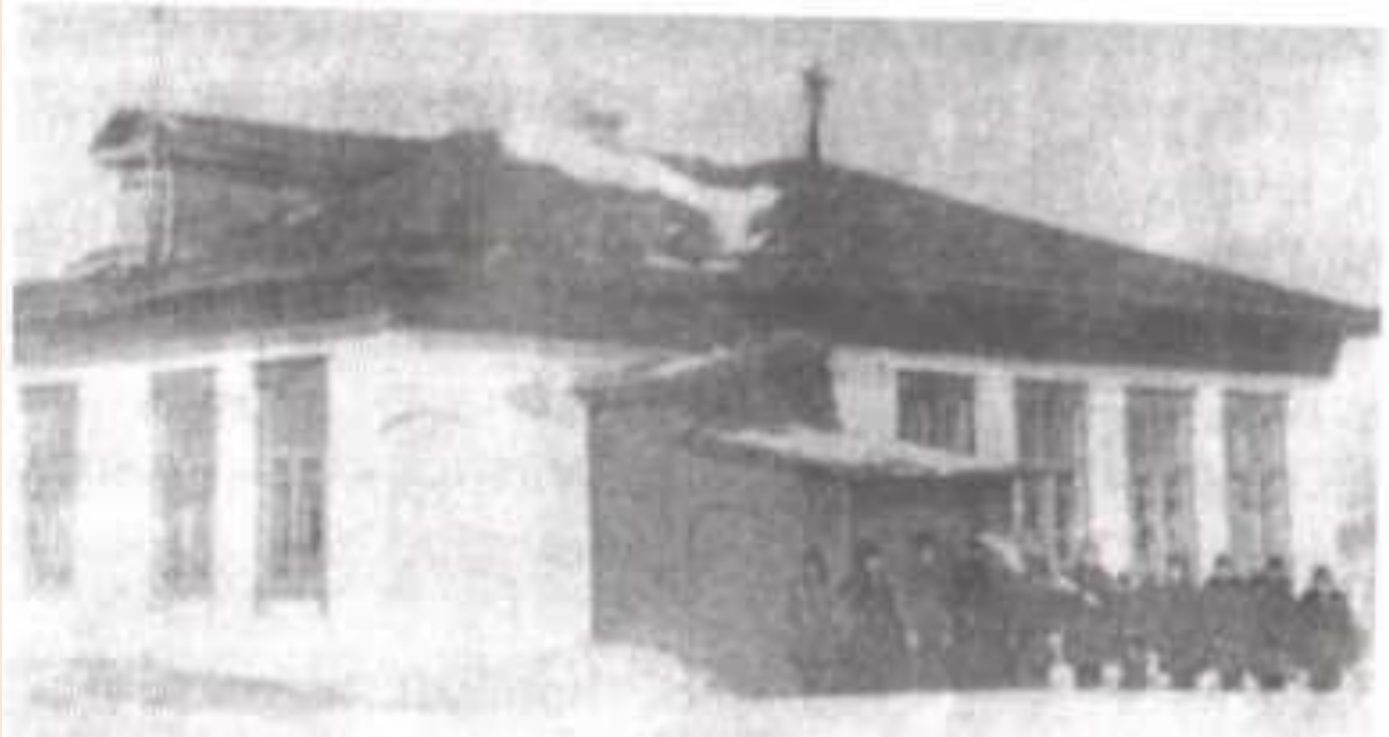
Здание школы в 1935 году