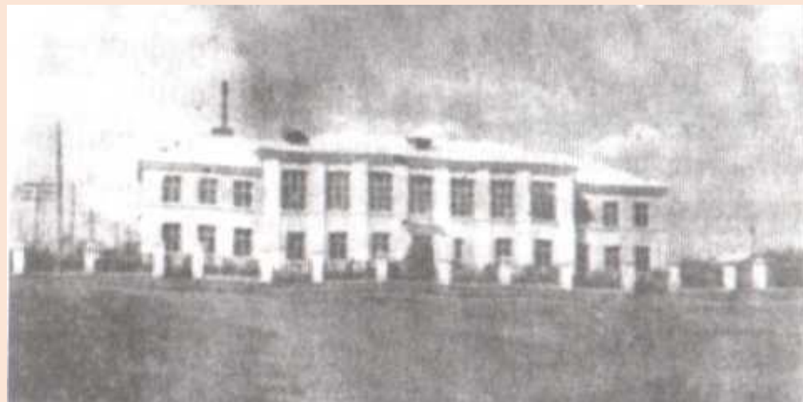
Здание школы по ул. Гагарина. 1959 год.