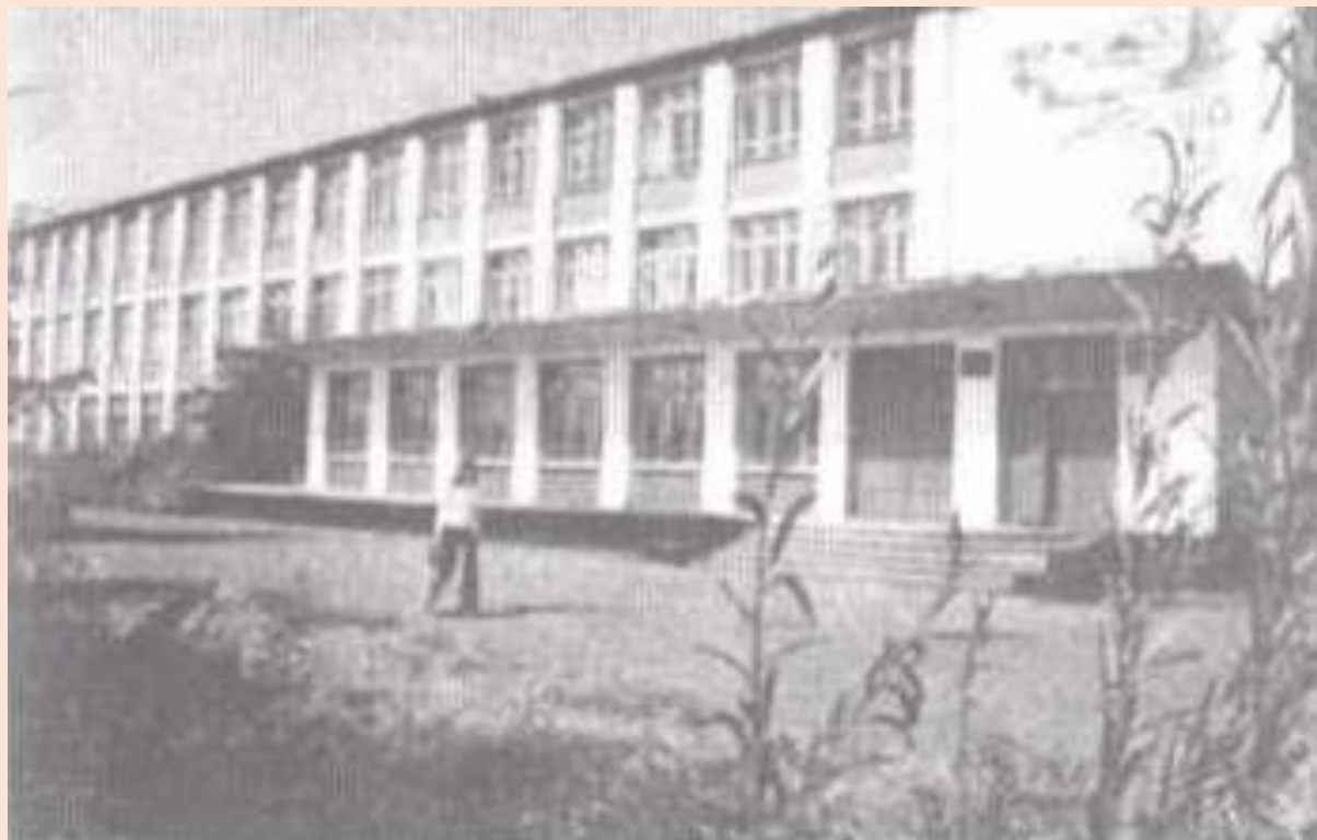
Таврическая средняя школа № 1 (1967-2014 гг.).