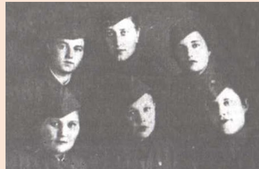
Со школьной скамьи на фронт.

Оставшиеся в школе учителя были отозваны из отпуска и включились в хозяйственную работу, ремонтировали школьные помещения, заготавливали для школы топливо, а с началом уборки хлебов вместе с учащимися работали в колхозах.